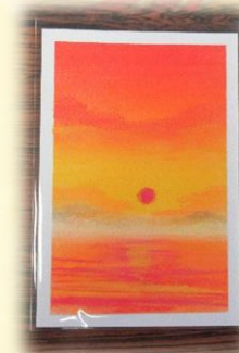
先生が即興で描いたサンプル絵です